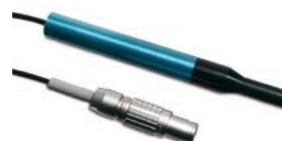
143001 Sonda per biometria 10 MHz