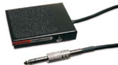
142003 Pedale per biometro e pachimetro