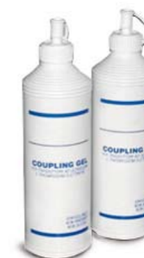
149005 Flacone di gel 250 ml (2pz/conf)