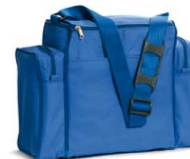
149004 Borsa per biometro e pachimetro