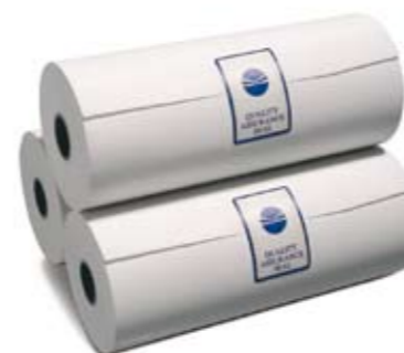
149003 Carta termica (3 rotoli)