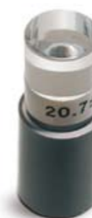
149001 Cilindro verifica calibrazione biometro