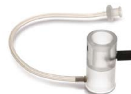
149008 Coppetta per biometria ad immersione Ø 18