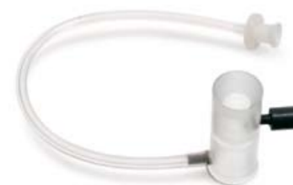
149006 Coppetta per biometria ad immersione Ø 14